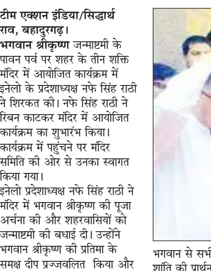
भगवान से सभी के लिए सुख शांति की प्रार्थना की। साथ ही उन्होंने पालकी यात्रा का भी शुभारंभ किया। इस अवसर पर

पहुँचे और लड्डू गोपाल के पूजा अर्चना की। इस अवसर पर सांस्कृतिक झांकियां, नृत्य, लघु नाटिका आदि मंच पर प्रस्तुत किया गया। इसके बाद दही-हांडी