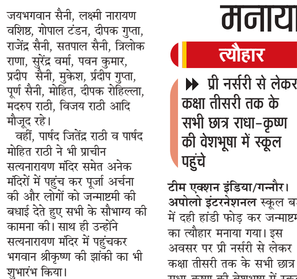
उन्होंने पालकी यात्रा का भी शुभारंभ किया। इस अवसर पर