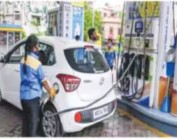
मुंबई में पेट्रोल 106.31 रुपये प्रति लीटर और डीजल 94.27 रुपये प्रति लीटर है। इसी तरह कोलकाता में पेट्रोल 106.03 रुपये प्रति लीटर है।

नई दिल्ली। सऊदी अरब के कुरुड ऑयल के उत्पादन में कटौती जारी रखने की खबर के बीच अंतरराष्ट्रीय बाजार में कच्चे तेल की कीमतों में तेजी जारी है। ब्रेंट कुरुड 91 डॉलर प्रति बैरल और डब्ल्यूटीआई कुरुड 88 डॉलर प्रति बैरल के करीब पहुंच गया है। हालांकि, सर्वजनिक क्षेत्र की तेल एवं गैस विपणन कंपनियों ने पेट्रोल-डीजल के भाव में कोई बदलाव नहीं किया है।