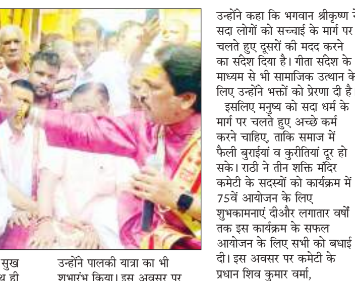
उन्होंने पालकी यात्रा का भी शुभारंभ किया। इस अवसर पर