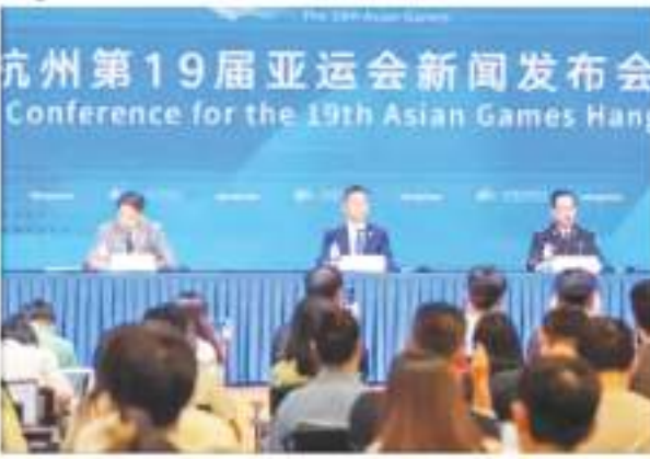
खेलों के हरित, स्मार्ट, किफायती और नैतिक होने के की योजना सादगी और एक उपयुक्त पैमाने पर जोर देती है।

हांगजो । हांगजो एशियाई खेलों के लिए मशाल रिले 8 सितंबर को प्रतिष्ठित वेस्ट लेक के पास शुरू होने वाली है। बुधवार को हांगजो एशियाई खेलों के मुख्य मीडिया सेंटर में एक संबद्धता सम्मेलन के दौरान इस बात की घोषणा की गई। सिन्हुआ की रिपोर्ट के अनुसार, मशाल अपने अंतिम चरण को पूरा करने के लिए 20 सितंबर को हांगजो लीटने से पहले, हुआड, जियाक्सिंग, शाओक्सिंग, निंगबो, झोउशान, ताडोड, चेन्गडो, लिगुई, जिहुआ और क्यूशोउ स्थित श्रेणियां प्रांत के 11 शहरों में होकर गुजरेगी। रिले में कुल 2,022 मशालधारक भाग लेंगे, जिनकी आयु 14 से 84 वर्ष तक होगी। लोकप्रियता के अनुरूप, हांगजो एशियाई खेलों के मशाल रिले मार्ग प्रत्येक स्थान पर रिले मार्गों का डिजाइन संबंधित शहरों की अनुरूप विशेषताओं, ऐतिहासिक और सांस्कृतिक महत्व और प्रकृतिक सुंदरता को बढ़ाता है। इसके अलावा, मशाल रिले में ऑनलाइन और ऑफलाइन दोनों प्रतिक्रिया शामिल हैं। 15 जून को एशियाई खेल ज्वलता संग्रह समारोह के बाद, डिजिटल टॉर्चबियरर ऑनलाइन रिले गतिविधि शुरू की गई थी। आज तक, 760 मिलियन से अधिक लोग एशियाई खेलों की ऑनलाइन मशाल रिले से जुड़े हैं, जिसमें डिजिटल टॉर्चबियरर की संख्या 84 मिलियन से अधिक है।