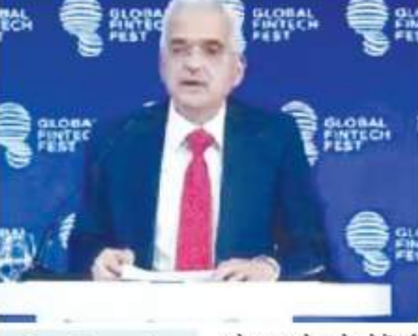
शक्तिकांत दास ने ग्लोबल फिनटेक फेस्ट (जीएफएफ) 2023 को संबोधित करते हुए यह बात कही।

ने यह कदम उन खबरों के बाद उठाया है, जिसके मुताबिक कई आयातक मसूर की दाल का स्टॉक कर रहे हैं। इससे दालों की कीमतें बढ़ने का डर है। इसके अलावा उपभोक्ता मामलों के विभाग ने जारी एक एडवाइजरी में तत्काल प्रभाव से दाल कारोबारियों और अत्याक्तों के लिए मसूर की (दाल) के स्टॉक की नियमित घोषणा सरकारी पोर्टल https://fcainfoweb.nic.in/psp पर करना अनिवार्य कर दिया है। यह निर्देश तत्काल प्रभाव से लागू हो गया है। सरकार ने इससे पहले जून में अरहर और उड़द के दाल पर स्टॉक लिमिट लगाने की घोषणा की थी। विभाग के मुताबिक सभी हितधारकों को शुक्रवार को मसूर (दाल) के स्टॉक की घोषणा करनी होगी। यदि कोई भी अपेक्षित स्टॉक फया जाता है, तो उसे जमाखोरी माना जाएगा और इसी अधिनियम के तहत उचित कार्रवाई शुरू की जाएगी। सरकार