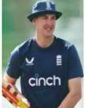
टीम में जोड़ने का मौका होगा। इसका मतलब है कि

नई दिल्ली । युवा और प्रतिभाशाली बल्लेबाज हैरी ब्लूक के लिए वनडे विश्व कप का दरवाजा अभी बंद नहीं हुआ है। न्यूजीलैंड के खिलाफ चार मैचों एकदिवसीय श्रृंखला और इस महीने के अंत में आयरलैंड से खेलने वाले दूसरे दर्जे की इंग्लिश टीम में शामिल होने के बाद हैरी ब्लूक के लिए विश्व कप खेलने का एक और मौका है। ब्लूक को हाल ही में विश्व कप के लिए अस्थायी टीम से बाहर कर दिया गया था। मुख्य कोच मैथ्यू स्टैट ने मंगलवार को बार-बार इस बात पर जोर दिया था कि आईसीसी को सौंपी गई 15 नामों की सूची केवल अस्थायी थी, और उनके पास आगले तीन हफ्तों में तीन और खिलाड़ियों को विश्व कप