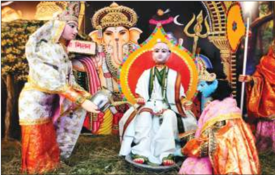
कानपुर में सनातन धर्म मंदिर में राधे कृष्ण की झांकियां सजाई गईं।

कोई फर्क नहीं पड़ता हमारे दादा की भी ऐसी धमकी मिली थी। उन्होंने कहा कि आज राष्ट्रपति द्रौपदी मुर्मू को पत्र भेज कर तत्काल प्रभाव से उनको अपदस्थ करने की हमने मांग की है। मैंने कहा है कि अगर ऐसा न हो तो हमें उनसे मिलने की अनुमति प्रदान कर दी जाए, क्योंकि दूसरे धर्म के बारे में किसी ने ऐसा बयान दिया होता तो अभी तक उसके चिथड़े भी न मिलते लेकिन सनातन पर जहां भारत के 100 करोड़ लोगों में से 80 प्रतिशत लोग इस धर्म को मानने वाले हैं, उन्होंने उनकी हत्या का आह्वान किया है।