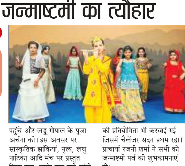
उन्होंने पालकी यात्रा का भी शुभारंभ किया। इस अवसर पर