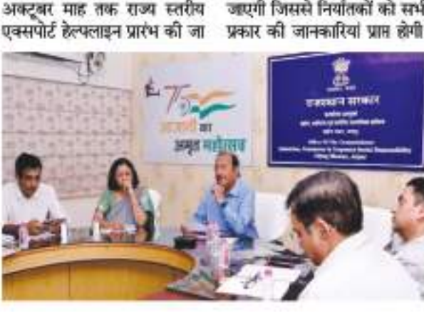
अक्टूबर माह तक राज्य स्तरीय एक्सपोर्ट डेल्फलाइन प्रारंभ की जा जाएगी जिससे निर्यातकों को सभी प्रकार की जानकारी प्राप्त होगी।