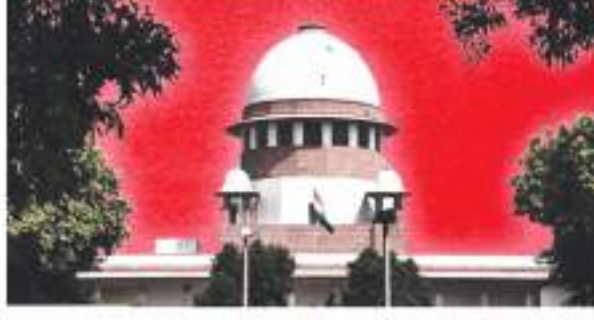
न्यायालय ने कहा था कि रग्मी चाहे ऑनलाइन या शारीरिक रूप से खेला जाता है, काफी हद तक कोशल का खेल है, न कि मौके का खेल और इस प्रकार गेमसक्राफ्ट के प्लेटफॉर्म पर खेले जाने वाले ऑनलाइन रग्मी गेम और अन्य डिजिटल गेम 'स्ट्रेटजिक' और 'जुआ' के रूप में कर योग्य नहीं हैं।

आदेश को चुनौती दी है, जिसमें कहा गया था कि 'रग्मी' चाहे दांव के साथ खेला जाए या बिना दांव के, जुआ नहीं है। उच्च न्यायालय ने कहा था कि रग्मी चाहे ऑनलाइन या शारीरिक रूप से खेला जाता है, काफी हद तक कोशल का खेल है, न कि मौके का खेल और इस प्रकार गेमसक्राफ्ट के प्लेटफॉर्म पर खेले जाने वाले ऑनलाइन रग्मी गेम और अन्य डिजिटल गेम 'स्ट्रेटजिक' और 'जुआ' के रूप में कर योग्य नहीं हैं। जीएस्टी अधिकारियों ने जारी किया था नोटिस